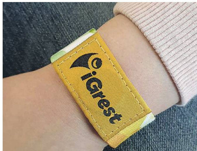
IL CHIP AL LORO INTERNO NON È NOCIVO PER LA SALUTE DEI BIMBI

no controllare in tempo reale informazioni, novità, documenti da scaricare, eventi a cui iscriversi, credito residuo e molto altro.