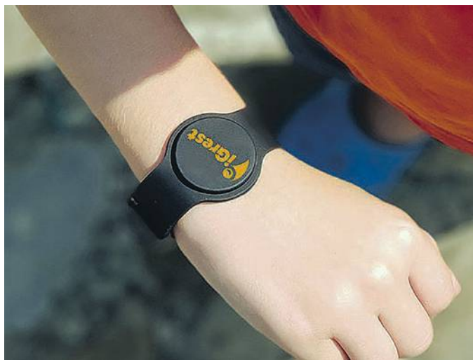
I BRACCIALETTI POSSONO ESSERE SIA IN SILICONE CHE IN TESSUTO

Serve solo un computer, un tablet oppure uno smartphone collegato a Internet: accedendo al software tramite la app gratuita i genitori posso-